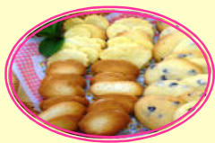
参加者プレゼント!!