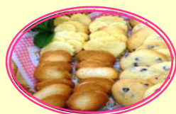
参加者プレゼント!!